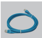
Кабель Ethernet категории 5e