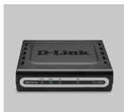
DSL-2500U ETHERNET- МАРШРУТИЗАТОР ADSL2+ ALL-IN-ONE

Если какая-то позиция отсутствует или повреждена, пожалуйста, свяжитесь с реселлером D-Link.