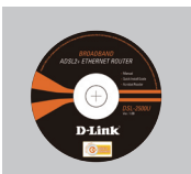
CD-ROM (с D-Link Click'n Connect, Руководством пользователя и гарантией)