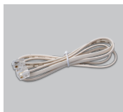
Кабель с разъемом RJ