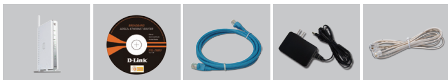
DSL-2650U WIRELESS G ADSL2+ ROUTER

Если какая-то позиция отсутствует или повреждена, пожалуйста, свяжитесь с реселлером D-Link.