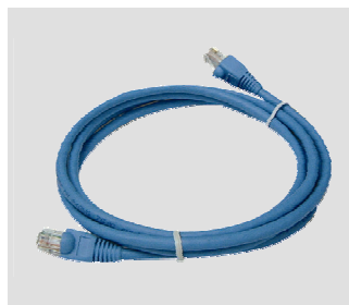
Ethernet (CAT5 UTP) kaabel