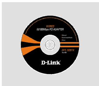
CD-ROM (D-Link Click'n Connect, kasutusjuhendi ja tarkvaraga)