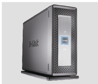
DNS-313 Üks kõvakettapesa 3.5" SATA kõvaketaste jaoks