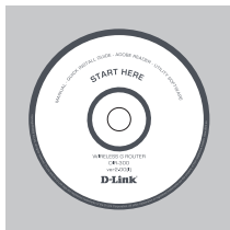
CD-ROM (Kiirpaigaldusviisard, kasutusjuhend)