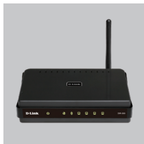
DIR-300/NRU Juhtmavaba ruuter

Kui midagi nimetatutest puudub, pöörduge edasimüüja poole.