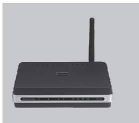
DIR-400 TRAADITA 108G RUUTER

Kui midagi nimetatutest puudub, pöörduge edasimüüja poole.