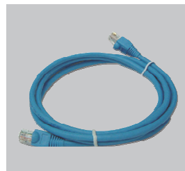
Ethernet kaabel (UTP 5 kategooria)