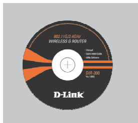
CD-ROM kasutus- juhendi ja kiir- installeerimisjuhendiga