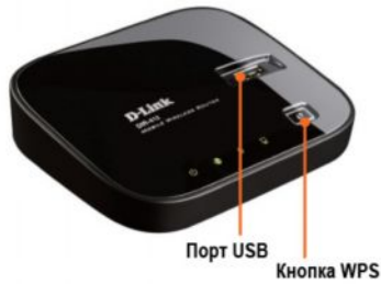
Порт USB Кнопка WPS