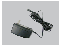
Адаптер питания постоянного тока