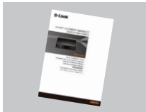
Руководство по быстрой установке