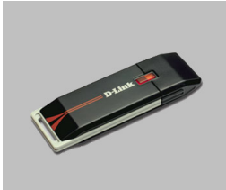
DWA-110 või DWA-120 Traadita G USB Adapter

Kui mõni nendest detailidest puudub või on kahjustatud, pöörduge kohe edasimüüja poole.