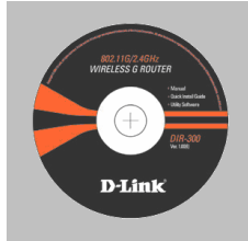
CD-ROM kasutamishend ja kiirinstalleerimisjuhendiga