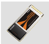
DWA-620 Wireless 108G Notebook Adapter

Если что-либо из содержимого отсутствует, пожалуйста, обратитесь к поставщику.