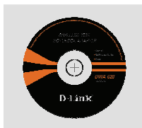
Компакт-диск (Установочный компакт-диск, руководство пользователя и гарантия)