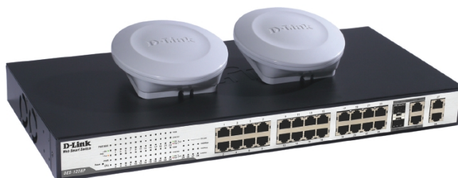
Беспроводная точка доступа DWL-3140AP 108G с поддержкой PoE