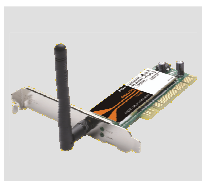
DWA-520 Wireless 108G Desktop Adapter

Если что-либо из содержимого отсутствует, пожалуйста, обратитесь к поставщику.