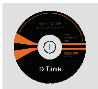
Компакт-диск (Установочный компакт-диск, руководство пользователя и гарантия)