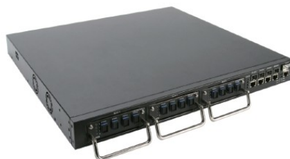
DPN-3012-E GE-PON OLT SWITCH

DPN-3012-E обеспечивает поддержку приложений, чувствительных к полосе пропускания, включая телевидение высокой четкости (HDTV), фильмы по запросу (MOD) и Voice-over-IP (VOIP). Устройство поддерживает полосу пропускания 1,25Гбит/с как для восходящего, так и для нисходящего потока, обеспечивая двунаправленную полосу пропускания 40Мбит/с для каждого из 32 абонентов, подключенных с использованием оптического сплиттера. Эта эффективная по стоимости технология обеспечивает надежную и масштабируемую архитектуру Ethernet и идеально подходит для реализации сервисов Triple-play. Кроме того, устройство обеспечивает простое управление и обслуживание.