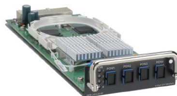
DPN-3012-E-01 OLT MODULE