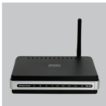
DIR-320 WIRELESS G ROUTER

Если что-либо из перечисленного отсутствует, обратитесь к поставщику.