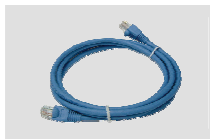
Кабель Ethernet (CAT5 UTP)