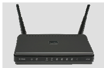
DIR-628 RANGEBOOSTER N® DUAL BAND ROUTER

Если что-либо из содержимого отсутствует, пожалуйста, обратитесь к поставщику.