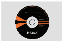
Компакт-диск (Мастер по быстрой установке маршрутизатора и руководство пользователя)