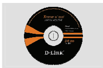
Компакт-диск (Мастер по быстрой установке маршрутизатора и руководство пользователя)