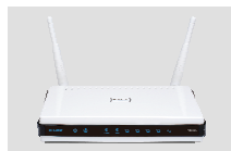
DIR-825 XTREME N™ DUAL BAND GIGABIT ROUTER

Если что-либо из содержимого отсутствует, пожалуйста, обратитесь к поставщику.