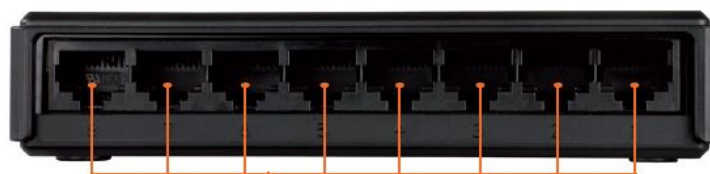
8 ПОРТОВ 10/100 BASE-TX

Для подключения к компьютерам, принт-серверам или сетевым хранилищам