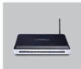
DVA-G3672B Wireless G VoIP ADSL2+ Router

If any of the items are missing, please contact your reseller.