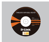
CD-ROM (D-Link Click'n Connect. Manual and Warranty)