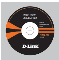
Компакт-диск (содержит ПО, Руководство пользователя и гарантию)