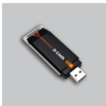
DWA-110 Wireless G USB Adapter

Если что-либо из перечисленного отсутствует, обратитесь к поставщику.