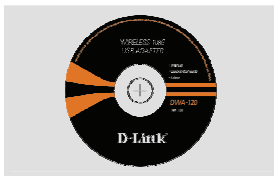
Компакт-диск (Установочный компакт-диск, руководство пользователя и гарантия)