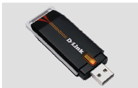
DWA-120 Wireless 108G USB Adapter

Если что-либо из содержимого отсутствует, пожалуйста, обратитесь к поставщику.